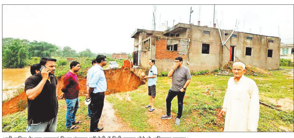
भारी बारिश के बाद सरगांव स्थित वृंदवन कॉलोनी में मिट्टी कटाव होने से क्षतिग्रस्त मकान।