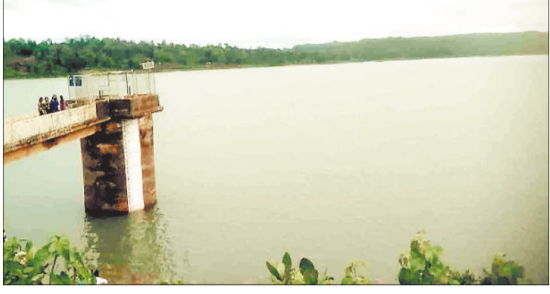
लबालब बांकी जलाशय।

पिछले एक पखवाड़े से हो रही लगातार बारिश एवं शनिवार को हुई भारी बारिश से भले ही जनजीवन प्रभावित रहा लेकिन बारिश सिंचाई बांधों के लिए काफी अनुकूल साबित हुई है। एक पखवाड़े में ही श्याम घुनचुड़ा बांध लबालब हो गया तथा बांध के पांच गेट खोलकर पानी बहाने की नौबत आ गई। पिछले 8-10 सालों से भीषण जल संकट से जूझ रहे बांकी जलाशय में 15 दिन में ही 60 फीसदी पानी भर गया है। तनिका फिल्टर प्लांट के माध्यम से लंबे अर्से से बांकी जलाशय के पानी का उपयोग पेयजल आपूर्ति के लिए किया जा रहा है। पिछले 8-10 सालों से बांध में आवश्यकता के अनुरूप पानी नहीं भर रहा था जिससे गर्मी के मौसम में शहर में पेयजल संकट की स्थिति निर्मित हो जाती थी। दो साल पूर्व गर्मी के दौरान बांध में मात्र 7 फीसदी पानी होने के कारण विपरीत स्थिति निर्मित हो गई थी। लंबे अर्से बाद पिछले साल बांध में 60 फीसदी पानी भरा था। इस बार प्रारंभ से ही अच्छी बारिश होने के कारण बांध में 60 फीसदी पानी भर गया है। जिससे विभाग के अधिकारी काफी उत्साहित है तथा इस बार बांध के