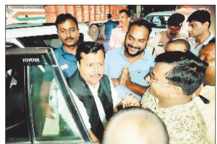
छत्तीसगढ़ के शिमला कहे जाने वाले मैनपाट में किया गया है जिसमें भाजपा के राष्ट्रीय अध्यक्ष जेपी नड्डा, गृह मंत्री अमित

बिश्रामपुर। श्रावण मास के अक्षर पर प्रति वर्ष की भांति इस वर्ष भी भोलोनाथ की भक्ति और जन अस्था का विराट संगम देवगढ़ धाम में भी के मिलेगी। महाशिवरात्रि के एक दिन पहले 22 जुलाई को सूरजपुर छठ घाट से हजारों श्रद्धालु भक्त जमदग्नि ऋषि की तपोभूमि और उरज वाहिनी पुण्य सलिला रेणुका नदी के तट पर स्थित अर्द्धनरेश्वर शिवलिंग का जलाभिषेक करने पदयात्रा पर निकालेंगे। श्रद्धालु मानते हैं कि अर्द्धनरेश्वर शिवलिंग का जलाभिषेक कर उन्हें जीवन में शांति, शक्ति और शिवकृपा का वरदान प्राप्त होता है। ज्ञात हो कि देवगढ़ धाम न सिर्फ धार्मिक दृष्टि से महत्वपूर्ण है, बल्कि यह स्थल पुरातात्विक व ऐतिहासिक दृष्टि से भी विशिष्ट है। रेणुका नदी के तट पर स्थित यह स्थल वह भूमि है, जहां ऋषि जमदग्नि ने तपस्या की और जहां श्रद्धालु आज भी शिव-शक्ति स्वरूप अर्द्धनरेश्वर की आराधना कर जीवन का कल्याण मांगते हैं।