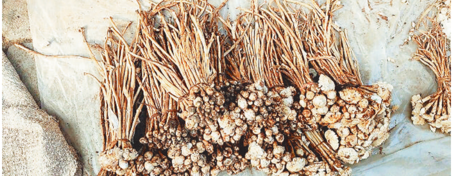
बाजार में बिक्री के लिए पतेरी खुखड़ी

रविवारीय बाजार में मौजूद मांसाहारी दुकानों के पास स्थित मार्ग की हालत अत्यंत दयनीय है। यह मार्ग जहाँ पैदल चलने वालों, दोपहिया वाहनों और छोटे व्यापारियों के लिए मुख्य रास्ता है, वहीं यह बड़े-बड़े गड़ों और दलदली मिट्टी के कारण दुर्घटना स्थल बन चुका है। स्थानीय लोगों ने बताया कि हर रविवार को कोई न कोई बाइक सवार इस मार्ग पर गिर जाता है। कई बार महिलाएं और स्कूली बच्चे भी चोटिल हो चुके हैं। बाजार में साइकिल और मोटरसाइकिल से आने-जाने वाले विद्यार्थियों के अभिभावकों में भय बना रहता है कि कहीं उनके बच्चों को भी चोट न लग जाए। लोगों का कहना है कि यह समस्या कोई नई नहीं है। पूर्व में भी पंचायत को कई बार लिखित आवेदन दिए गए, लेकिन हर बार केवल खानापूर्ति की गई। रास्ते पर थोड़ी-बहुत मिट्टी डाल दी गई।