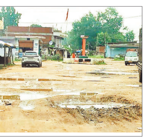
साप्ताहिक बाजार परिसर में कीचड़ व गड़ु।

नगर पंचायत शिवनन्दनपुर का प्रमुख रविवारीय हाट-बाजार इन दिनों मूलभूत सुविधाओं के अभाव के कारण परेशानी का केंद्र बना हुआ है। हर रविवार को दूर-दराज से आने वाले ग्रामीणों और स्थानीय व्यापारियों के लिए यह बाजार आजीविका का प्रमुख साधन है, लेकिन वर्तमान में यहाँ की जर्जर स्थिति लोगों की रोजी-रोटी और सुरक्षा दोनों पर संकट बन गई है। गौरतलब है कि सोमवार को रविवारीय बाजार के दुकानदारों ने नए शिवनन्दनपुर सीएमओ को ज्ञापन सौंप उल्लेख किया है कि बाजार क्षेत्र में बारिश का पानी जमा हो जाता है, जिससे न सिर्फ कीचड़ फैलता है, बल्कि दुकान लगाने की जगह ही नहीं बचती। ग्रामीण क्षेत्रों